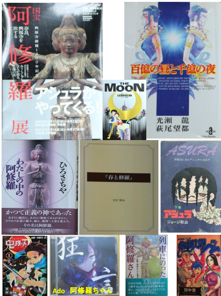
図 1. 阿修羅に関連した作品

ここに出てくる鬼たちは飢餓によってだけではなく、強くなり人間や鬼を支配する権力を得るために人間を楽しみで沢山喰うのである。彼らは思い違えた家族への心に飢えており、それを権力で置き換えていたのである。鬼より恐ろしいのは人間の心の闇に深く潜み澱む毒である。毒を溜め込んだ人間は残念なことに実在している。鬼は見た目が怖く。毒人間は見た目ではわからない。鬼は人間の心の闇の中に隠れ住んでいる。恐ろしいのは鬼よりも人間だ。何故なら、鬼の姿は見るからに恐ろしいが、人間の姿は神に似せてあり、一見では優しいか恐ろしいかはわからない。