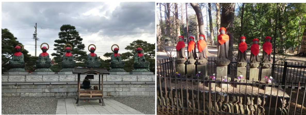
左) 長野善光寺の六道地蔵尊 : 天道、人間道、修羅道、畜生道、餓鬼道、地獄道 右) 狛江泉龍寺の六道地蔵大菩薩 : 天道、人間道、修羅道、寄進者、地獄道、餓鬼道、畜生道 私見) 天道、修羅道、人間道、畜生道、餓鬼道、地獄道