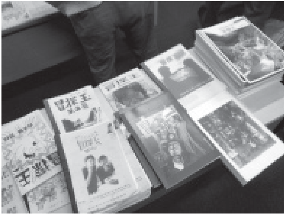
1990年以降に入ってから『冒探王』