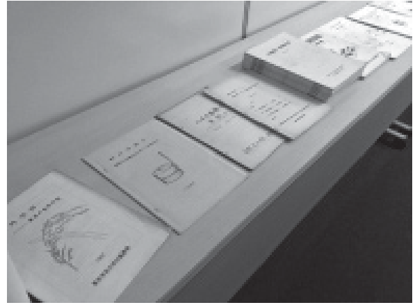
1983年ころの『野外学習』ほか