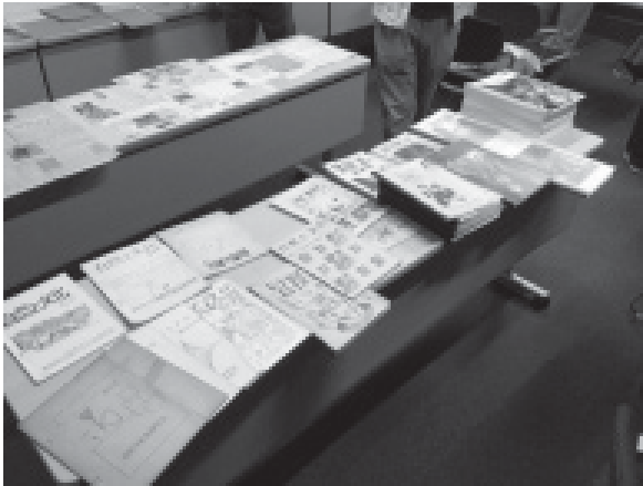
最初に発行した『自然と文化』