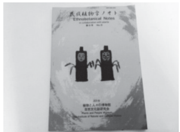
最近発行を続けている『民族植物学ノオト』