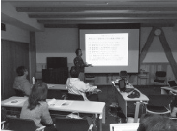
小菅村～現在（鈴木英雄）