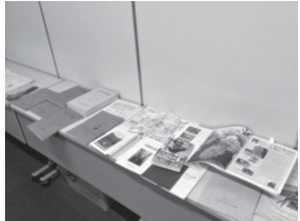
「環境教育報告」「大滝村のマップ」など