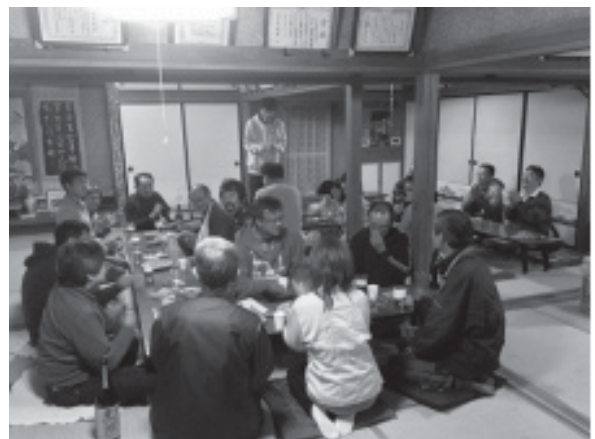
宴会 小菅村船木民宿にて