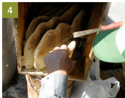
4 巣箱を逆さにしてへらではがしていく