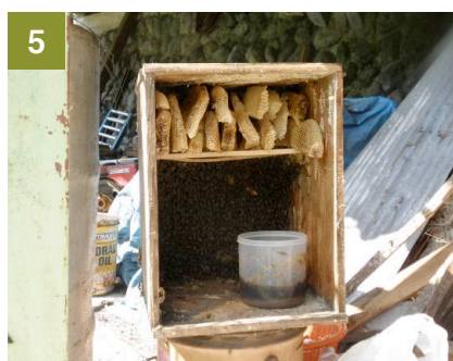
5 蜜の入った巣と入ってない巣を木を渡した上に詰めて残す。餌を入れて表面を閉じる。