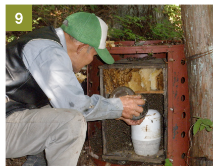
9 餌を置いて巣箱を閉じる。