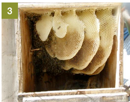
3 巣箱をあけたところ