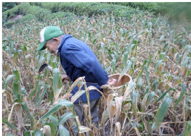
▲ 早朝のヒエの穂つみ

収穫後はナメコとり作業。小指の先くらいの大きさ以上のものを収穫する。ヒエの畑から下がった沢にちかいところにホダギを並べてある。