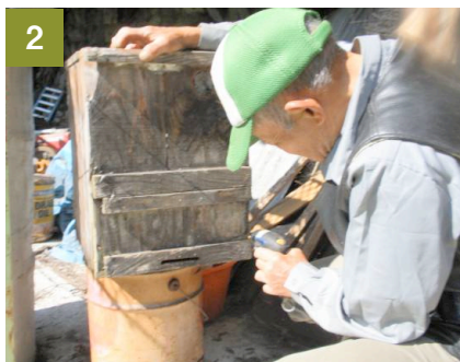
2 檻から取り出した巣箱を電動ドリルでねじをはずしてあける