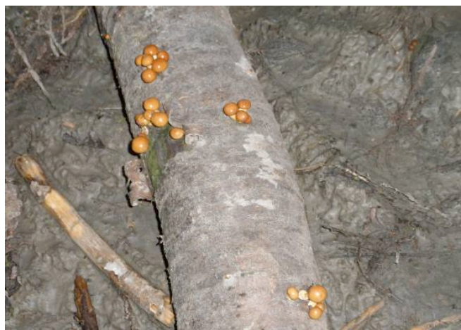
▲ 山で栽培されているナメコ