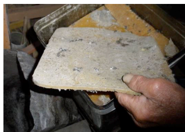
▲ 巣を1斗缶で煮て固めたシート