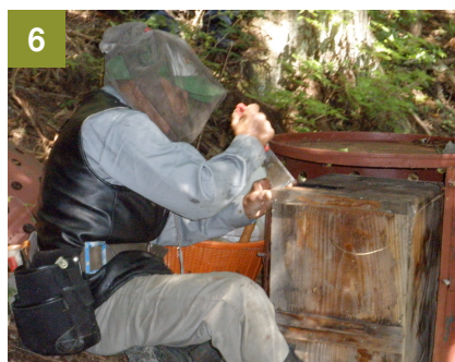
6 山の中に置いた巣。 ドラム缶から出して表面をひらく。