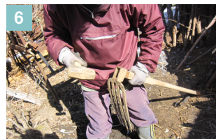
▲木槓でさらに差し込む。