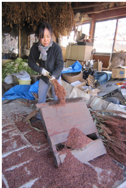
▲タカキビを千刃コキで籾取り（特に種子蒔き 用は、種子が傷つかないよう千刃コキで）