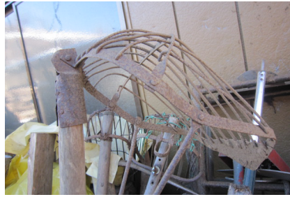
▲麦の土入れ。土を麦の上から蒔く。 害虫・霜降り対策。