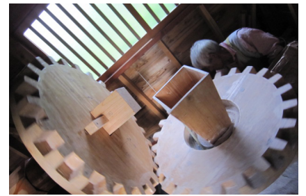
▲水車小屋の中は、木製の水力製粉器が動いている