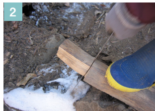
▲鍬の打ち込み用楔の作成。杉の木を使用。鍬の楔用にやや大きめに切る。