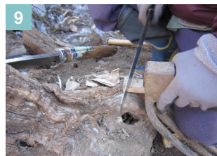
▲出過ぎた楔の先をのこぎりで切る。