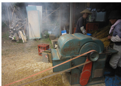
▲後ろから不要な籾殻が風で飛ばされる

大麦・小麦の機械での脱穀 穀物は捨てる所がない。分別された籾殻 と藁はトタンの上で燃やして灰に。灰は 蕎麦の畑に肥料として蒔く。