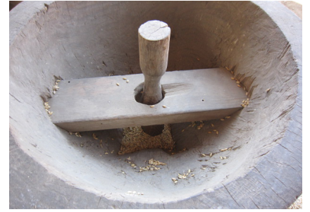
▲この上に粃を入れる