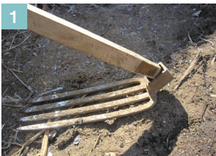
▲緩んだ楔を取り、鍬の刃と柄を外す。