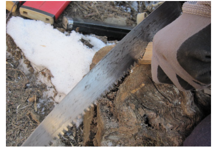
▲のこぎり：普通の作業：横引き用 (あせり出しと言い刃先が曲がっている。 木にひっかからないように) 丸太切り用：縦引き用 (刃先が立まっすぐになっている)