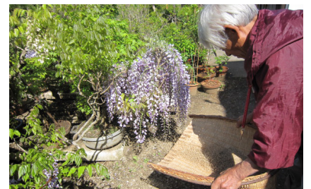
▲殻吹き 種子蒔き用の種子と不要な粃殻や 小さな石等を、箕を上下に振り降ろし息を 吹きかけながら飛ばす。