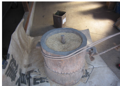
▲臼と臼の間から粉が出てくる