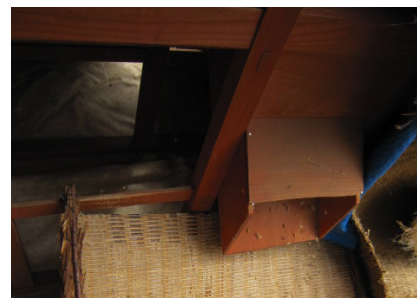
▲反対側にはほぼ完璧に籾殻が取れた雑穀が 仕訳されて出てくる