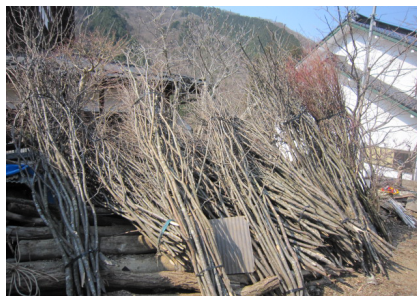
▲近隣の林で収穫。今は、隣村でもらったり、購入したりしている。(里山が減少してきた証拠)