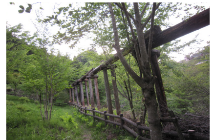
▲近くの川から水を運んでくる水路。木製。 定期的なメンテが必要。木材の利用にもなる