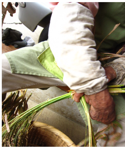
▲数本束ねた葉を使ってクロスさせた根元を結ぶ。