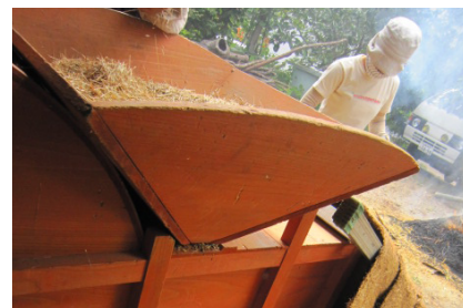
▲不要な籾殻がややついてくる雑穀が出る穴。 再度唐みにかけたり臼でこすり籾殻を取る。