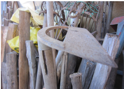
▲平鍬（ひらぐわ）：土を盛る。