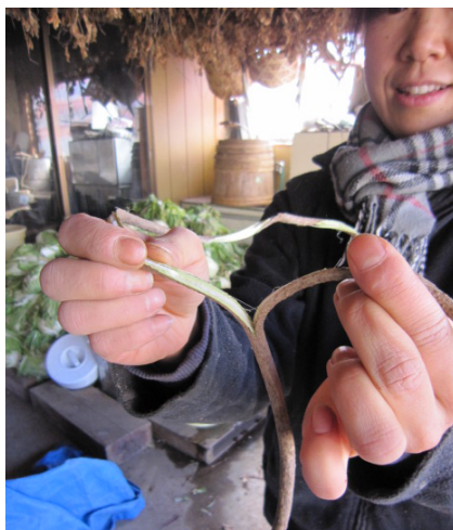
▲タカキビを束ねる紐：藤の蔓。割いて紐として使う