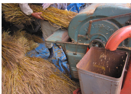
▲脱穀された麦が出てくる筒