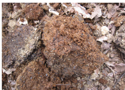
▲草幹等を燃やし灰をつくり肥料として使う