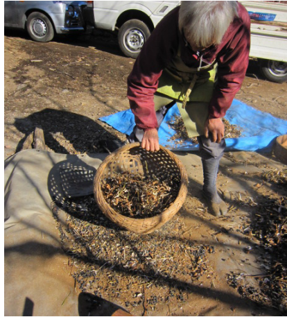
▲大豆は木槌でたたいて外皮を取る