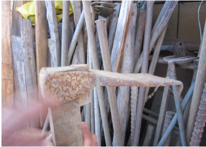
▲ごぼう・長いもなど細長い作物を掘る時に使う。