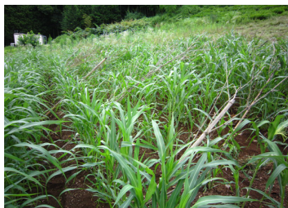
▲雑穀が腰くらいの高さになったら、雑穀の穂が倒れないように支えるため。横幅1m間隔で、3列程度またぐようにやたを斜めに差し立てる。