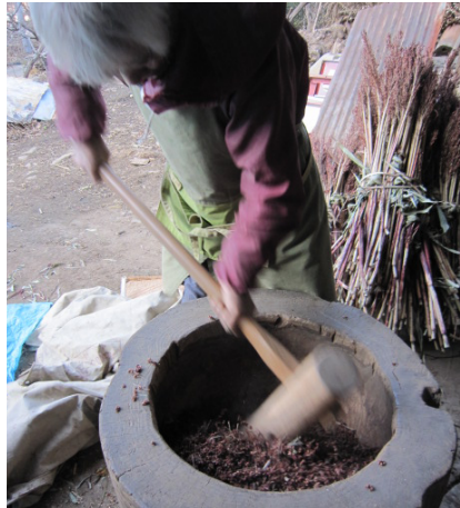
▲タカキビ：杵・臼でこすって粉を取る。 この後製粉。