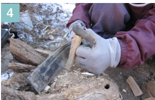
▲ざやなで、さらに模型に形を整えていく。小さくしすぎないように注意する。