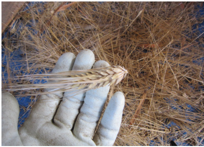
▲千刃コキで取った麦穂