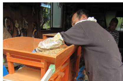
▲千刃こきでこした籾を唐みに入れる。 詰まらないように手で籾を均す。