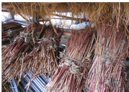
▲脱穀した後はきれに束ねる。 後に肥料やほうきを作り再利用