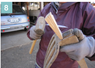
▲楔を木槓で打ち込む。打ち込み場所は、柄の内側。金属の楔は逆に柄の外側に打ち込むと、外れにくい。