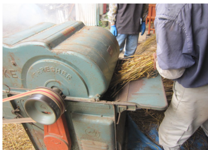
▲脱穀機械 穂先のみ機械に突っ込む