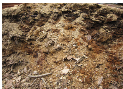
▲堆肥（落ち葉・残飯・牛糞等）