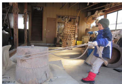
▲昔の木製臼 紐を左右に動かして 粃取りや粉にする