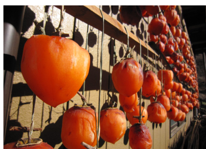
▲柿のヘタに通して、やじろべえのように両側に柿を縛り干す。普通の紐だと風でぐるぐる回ってよじれてしまうが、シュロだと大丈夫