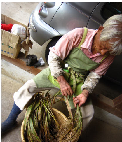
▲穂を2束手に取り、根元をクロスさせる。