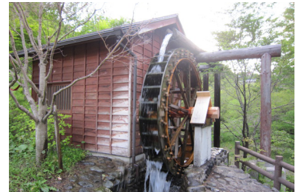
▲びりゅう館の水車小屋