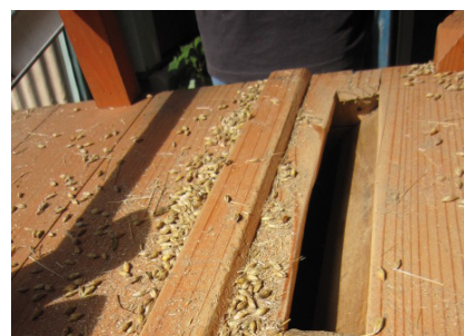
▲籾殻を取る強度調節用の溝。