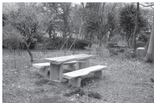
図7. 万葉池の周辺、伐採した木で作ったテーブルとイス