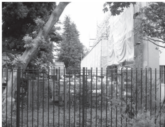
図3. 芸術館の空調を学外から見る

本部棟にはヘチマやゴーヤのグリーンカーテンが張られ、いくぶんかの冷却効果をあげている。駐車場周辺はやはりケヤキなどが伐採され、明るくなり、ツツジなどの花木が新たに植栽された。これらは前学長が退職される年度末に実施されたことである。学長裁量経費の多くが造