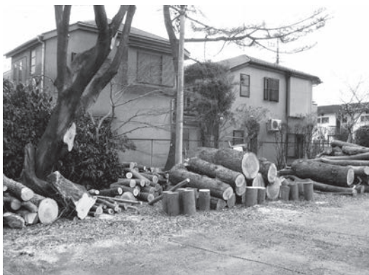
図4. 本部棟の南、駐車場