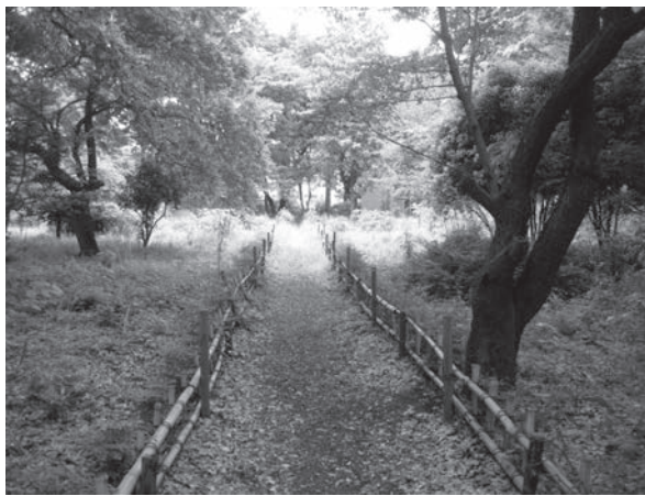
図9. 苗圃跡のボタン園

修復は学校園の講義で受講学生と共に行う計画でいた。ところが、演劇部は約束に反し、資材を片付けないばかりか、さらに廃材を放置、かつ捨てたので、冷蔵庫や扇風機など家庭電気製品が捨てられるようになった。人の心を演じるのが演劇ならば、やむを得ずに木々を伐った人の心や植物の心を全く意に介さず、さらにごみを捨て続ける演劇部は悪徳業者ならぬ悪徳学生である。演劇の練習をしている学生たちをとらえて、まずは聞いてみた。3グループあるそうで、聞いたグループは絶対に投棄はしておらず、劇団猿がしているのだという。事実、新しい廃材から劇団猿とマジックで書かれた物的証拠が出てきた（図10）。