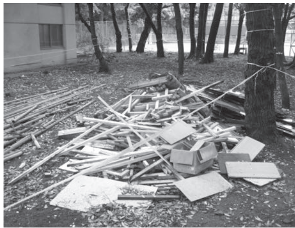
図10. 再びゴミ捨て場に・・・はさせない