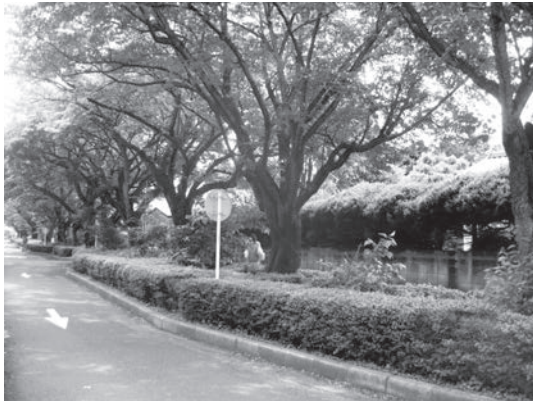
図1. 正門通りの樹下

国立大学法人になって、大きいが軽い看板が正門への入口にできた。元あった重い石の表札は道路の中央分離帯に移動されたが、交通標識に隠れてよく見えない。正門への道は小金井キャンパスを象徴する桜並木である。この樹下には色々な低木が植えられ、かなり良好に管理されていた。前学長は中国の大学で感銘を受けたということで、清々しい香りを放つロウバイをさらに樹下に補植された（図1）。密植状態が気になる。