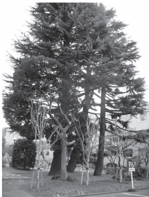
図6. 茂っている木の枝を払って、サルズベリを密植している

ところが、この場所の木々もすっかり伐採されて、万葉池の周辺は明るくなり、テーブルやベンチも置かれるようになった。国立大学法人の学長権限は絶大で、教授会での議決は何であったのかと思うのである（図7）。