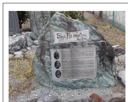
内村鑑三が最後の仕事として日本村塾教育を託した興農学園跡地の碑